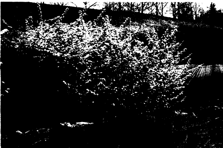
한국성균관대학교에서 개발한 가시 없는 한국자생종 콩배 개화사진

콩배는 1918년 윌슨에 의해 처음 미국으로 도입된 이후 1952년에 Karl, Sax가, 1963년 가을에는 이평수와 Westwood박사가, 1965