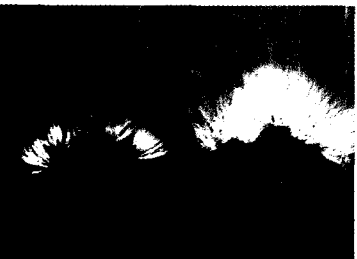
1. 미국 뉴욕의 부르클린 수목원에 재식된 한국산 왕자귀나무