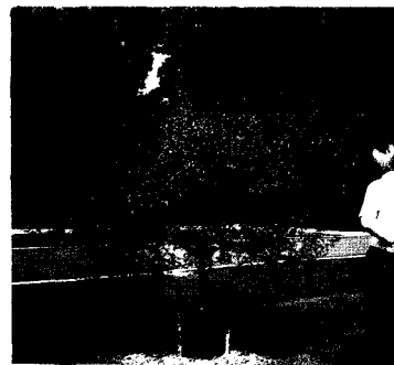
한국에서 도입한 미국 모리스 수목원에 재식된 콩배나무

1908년 콩배나무가 중국으로부터 미국에 처음 도입된 이후 1918년 미국의 머이어가 콩배 종자로부터 'Bradford' 품종을 선발 하였다. 미국홍배는 처음에는 열매가 좋고 화상병(fireblight)에 내성인 수종을 육성하기 위해서 도입되었으나, 도입되어서는 가로수와 관상수로서의 가치가 더욱 인정되었다. 미국에서는 지속되는 홍배나무 신품종 육성노력이 계속되어 왔고 앞으로 계속될 것으로 보인다. 미국에서의 홍배나무 신품종육성 노력을 보면, 가을 단풍이 붉게 물들여 매우 아름다운 'Aristcrat'와 가을 단풍이 선홍색으로 오랜기간 지속되는 'Autumn Blaze', 그리고 가을에 잎이 구리빛으로 물드는 'Capital', 또한 'Bradford' 보다 수형이 직립성이고 질감은 더 부드럽고 잎의 지속기간이 긴 'Chanticleer' 품종이 육성되어 있고 그밖에 'Redspire', 'Trini', 'Whitehouse' 등 미국홍배에는 여러가지 관상치가 뛰어난 품종들이 개발 육성되어 있다. Forest farm 회사에서 5gallon pot에 수고 1.5-1.8m되는 나무가 $ 22.00에 판매되고 있다. 1991