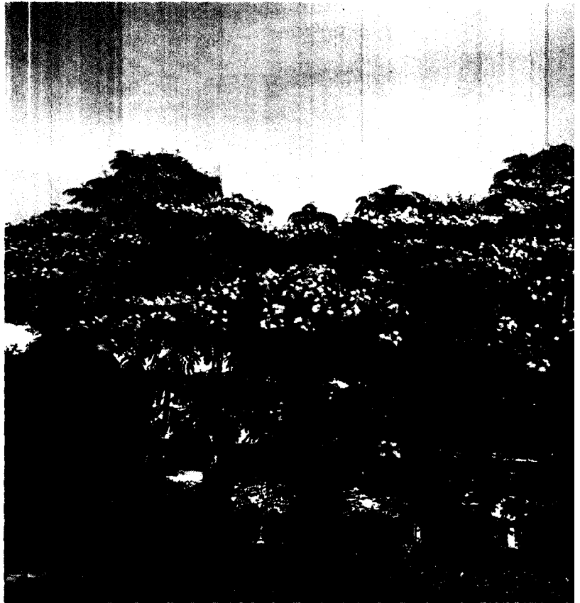
성균관대학교에서 선발실험중인 흰자귀나무