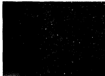
미국에서 많이 재배되고 있는 홍배의 단풍 전경