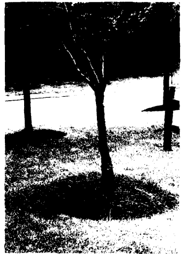
1. 도시림 가장자리에 국수나무, 병꽃나무 등 주연부 수종을 식재하여 생태적으로 경관적으로 좋은 경관을 만들고 있다.(서울시 종묘, 1985)

넷째, 도로와 보도의 폭, 방위, 주변 시설물과 건물 등 가로특성, 도시계획차원에서의 동·식물이동통로를 위한 녹지연계성, 각 도로의 장소성과 독자성, 대기오염농도, 가로수의 다양성 등을 고려한 가로수 기본계획을 장·단기적으로 수립한 후, 변경 및 식재해나가고 기존 가로수는 도로폭 변경계획이 없는 도로부터 통기 및 관수시설, 유효도량공간 확보, 답압방지덮개 등의 토양개선과 다양성, 균질미를 유지하는