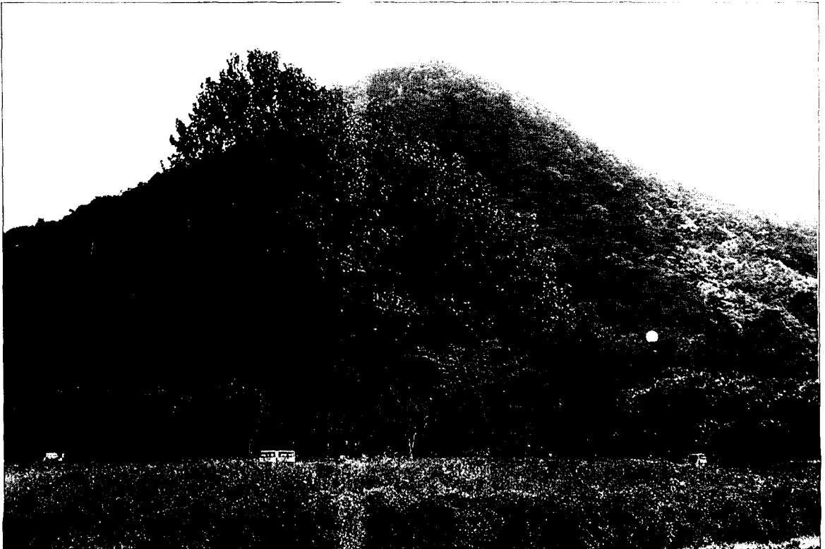
3.무계획적으로 식재한 플라타너스(수고 20m)가 생장하여 기존 식생과 이질감을 주면서 산림경관을 훼손하고 있다.(광주시 무등산 도립공원)

2차 천이한 자생식물군집지역의 녹지관리목표는 과거의 보호, 관리의 개념에서 현재 진행중인 식생천이 발달을 촉진시켜 녹지연도(DGN) 9등급의 보전관리로 변경하고, 토양산도의 중화 등 환경오염을 완화할 수 있는 기술을 연구, 개발해야 할 것이다. 도로 및 시설물주변, 또는 산림내에 소반상(小斑狀)으로 조림