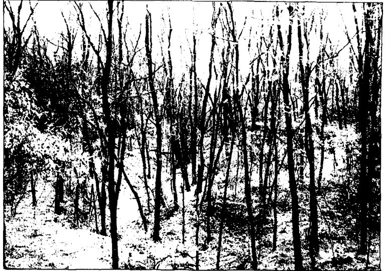
4.치산녹화한 아까시 나무림의 임상층(林相層)에서 활착하고 있는 상수리나무 등 자생식물집단의 성장을 촉진시키기 위하여 주위 아까시나무를 택벌하는 것이 필요하다

도시녹지 중 일부는 과거 치산녹화, 사방 또는 조림 목적으로 아까시나무, 은사시나무, 리기다소나무, 편백나무, 잣나무, 독일가문비나무 등이 조림되어 있다. 일부 도시림은 전체가 몇 수종으로 조림되어 있고, 도시섬(Urban Island)화하여 자생종의 종자전파가 어려운 관계로 임상층(林床層)에 자생종이 거의 출현하지 않고 있다. 이러한 조림식생지역에는 천이계열상 발전기에 속하는 양수계열의 수종(참나무류, 팔매나무, 귀룽나무, 오리나무, 때죽나무 등)을 묘목식재(2~3년생) 또는 파종 등으로 도입해 주면서 외래수종을 택벌해 나가야 실효를 거둘 수 있다. 그러나 주변식생으로부터 자생식물의 활착이 용이하여, 임상층에 자생종들이 활착하고 식생천이가 진행되는 곳의 조림식생은 활착한 자생수종 주변의 조림수종을 택벌시업을 통해 단계적으로 제거하면서 자생종의 활착, 발달을 촉진하는 식생관리가 필요하다(사진 4).