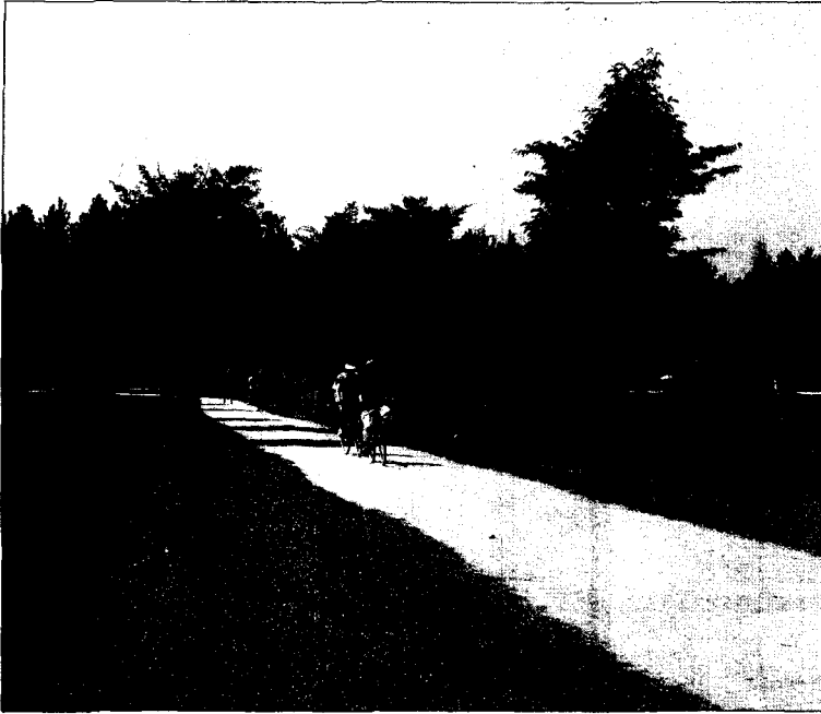
산책, 조깅, 자전거타기등에 적합한 선형 도시림

교적 반복적인 방문이 관찰되고 있다. 방문전 기대정도는 5단계 척도하에서 자연경관의 수려함과 지명도가 자원의 성격별로 다소의 차이를 보이는 가운데 긍정적으로 나타나는 반면 청결, 안전과 혼잡에 대하여는 보통, 혹은 부정적인 것으로 나타나 도시림의 현실상을 잘 대변하고 있다. 방문동기는 대상지내의 시설에 따라 상이하게 나타나는데 체육 위락시설이 비교적 갖추어진 보문산의 경우 친목도모가 가장 큰 비중을 차지하는 반면, 산행위주의 관악·팔공산의 경우 “몸과 마음을 새롭게”와 “자연감상”을 위하여가 중요한 동기로 부각되고 있다.