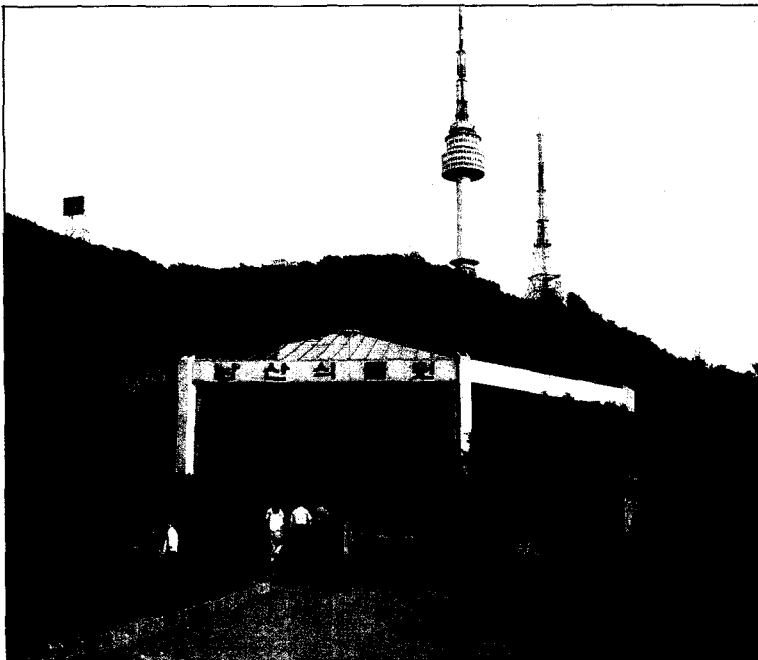
서울시민에게 휴양편익 및 심미적 편익을 제공하는 남산

휴양행동은 반복적인 "휴양생활"으로 유형화된다. 이론적으로 휴양참가자는 참가활동에 근거하여 분류되어지며 특정 모집단 내에서 활동에 참가하는 하부집단의 구성원으로 간주된다. 따라서 문제의 시각이 단순히 개인에 있지 아니하고 특정 활동에 참가하는 개인에 있다. 만약 특정 개인이 한 활동에서 다른 활동으로 이동하게 되면 그는 상이한