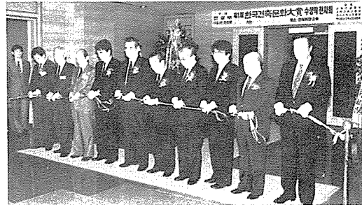
「한국건축문화大賞」 개막식 테이퍼 절단식 광경

한편, 이번 제 1회 『한국건축문화대상』전시는 건설회관 2층 전시장에서 10월 31일까지 계속 된다.