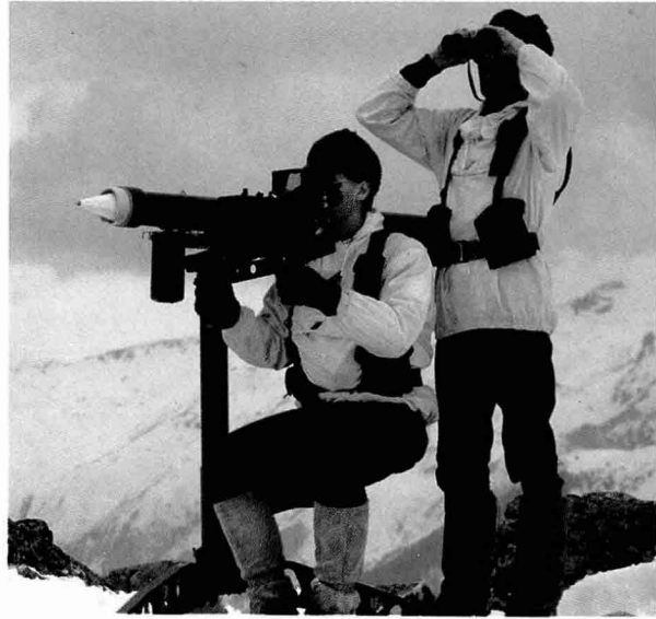
미스트랄(Mistral) 대공미사일 주요 제원

이 무기체계 구입계약에 따라 금성정밀(7% 내외)등 국내업체와 25%의 절충교역이 이루어질 것으로 예상된다.