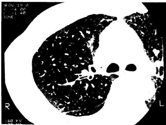
Fig. 4. High resolution CT showed diffuse multiple cystic changes.

였고 Tetracyclin을 이용하여 흉막 유착술을 시행하였으며 Tamoxifen으로 항에스트로젠 치료를 시작하였다.