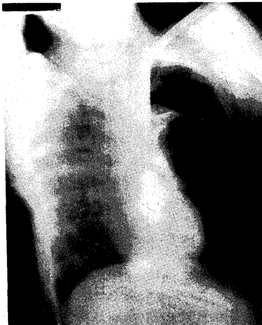
Fig. 1. Chest PA showed left pneumothorax with total collapse of left lung.