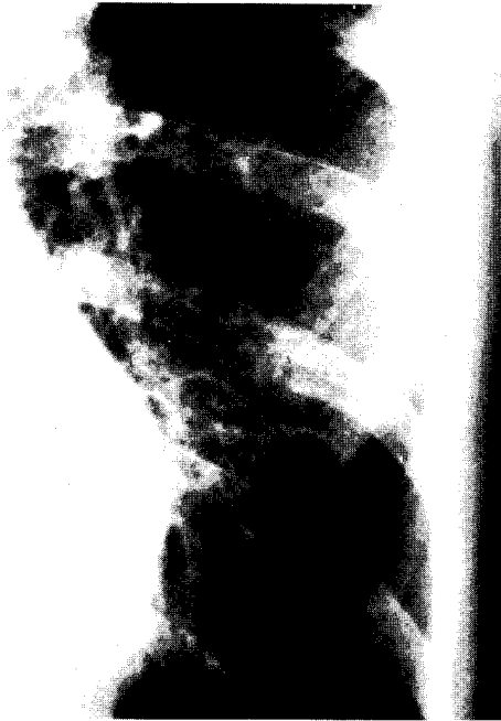
Fig. 3. Chest PA showed fine reticulonodular densities.