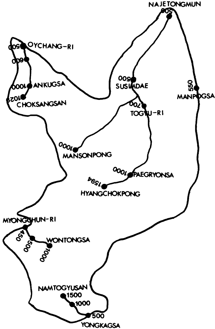
Fig. 1. The course and spots for ants collection in Mt. Togyeusan. ● : collecting spots

포하고 있는 종은 일본침개미( Pacycondyla astutus ), 일본장다리개미( Aphaenogaster japonica ), 극동흑개미( Pheidole fervida ), 한국홍가슴개미( Camponotus atrox )와 6종 이었으며 각기 1개 지역에서만 채집된 종은 장님침개미( Cryptopone sauteri ), 노란미트리개미( Crematogaster