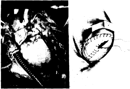
Fig. 4. Operative finding(After reconstruction of LVOT)