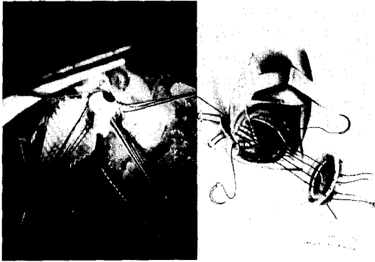
Fig. 3. Operative finding(after enlargement of annulus)