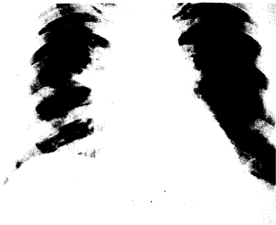
Fig. 1. 내원 당시의 흉부 X-선

술과 우측 분지하, 기관주위 임파절등을 박리 절제하였으며, 술후 조직검사상 이 임파절에서 암 전이가 있어 T 2 N 2 M 0 (Stage IIIa)로 방사선치료를 시행후 경과 양호한 상태로 퇴원하였다.