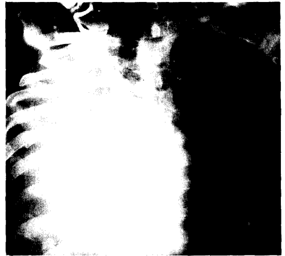
Fig. 5. Stent Apply후의 Venogram.

또한 정맥과 Bypass Graft후의 협착은 재발율이 높고, 확장시키기 어렵기 때문에 Endoluminal Mechan-