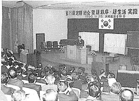
제25회 정기총회 속개회의