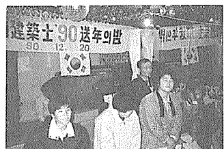
전남지부 소년소녀가장돕기 성금전달

또한 각 분소별로 불우이웃돕기 성금을 조성하여 관내 행정기관등에 기탁하는 한편 지부에서도 관내 행정기관 및 안양시 소재 녹향원등에 성금을 기탁하여 활발한 불우이웃돕기 사업을 전개하였다.