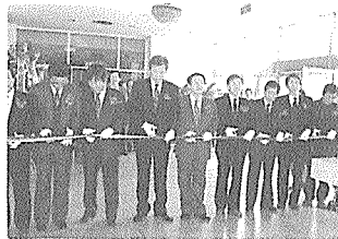
대구지부 회원작품전 개막식

大邱지부(회장 張基雄)는 구립 8일 대구시민회관 대전시실에서 지역 건축문화의 발전을 촉진시키기 위한 제 4회 건축사 작품전 및 제 3회 신인·학생건축작품전의 개막식을 갖고 5일간의 전시행사를 실시하였다.