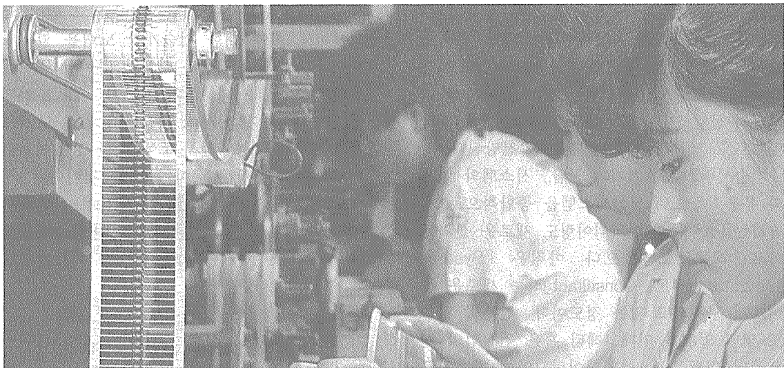
FA기기간의 호환성을 제고하여 기종간 표준화 노력은 체계적으로 진행되어야 한다.