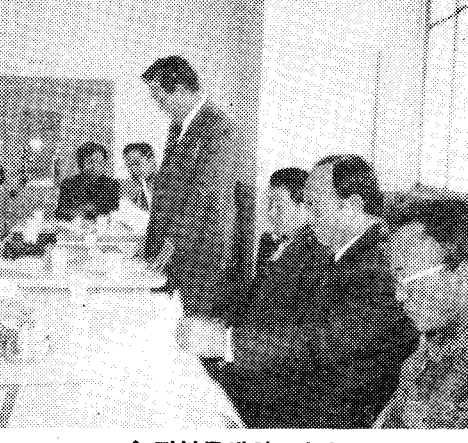
◇ 전북특별자치회 광경

11월 14일, 瀋陽市에서 定期 會議을 開行하였다. 本支部의 事務를 報告하고, 協同 實 施를 議결하였다.