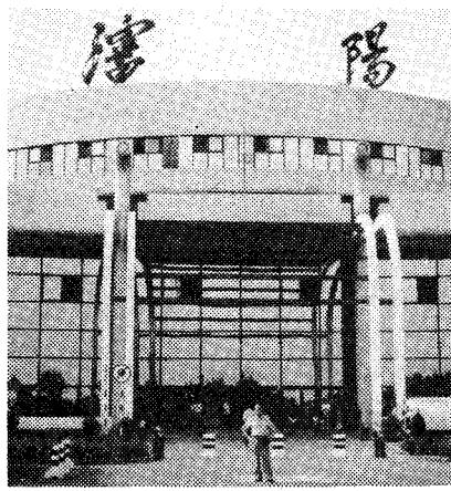
◇ 심양 약원에서

瀋陽은 中國의 重要한 工業 都 市로 1945년 8월 15일 일본의 패배 후, 중국 내에서의 전쟁, 특히 대륙에서의 전쟁을 통해 고국에서 멀리 떨어진 곳에 정착하였다. 그는 1945년 8월 15일 일본의 패배 후, 중국 내에서의 전쟁, 특히 대륙에서의 전쟁을 통해 고국에서 멀리 떨어진 곳에 정착하였다. 그는 1945년 8월 15일 일본의 패배 후, 중국 내에서의 전쟁, 특히 대륙에서의 전쟁을 통해 고국에서 멀리 떨어진 곳에 정착하였다.