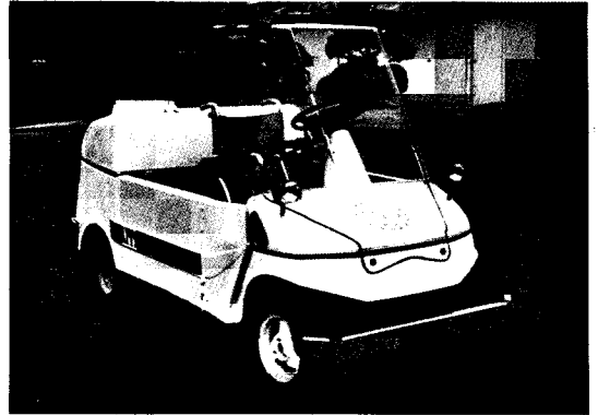
사진 2) 전지구동시스템을 장착한 장애자용 특수 차량

무공해 차량으로서 궁극적으로 개발하지 않으면 안될 실정이므로, 그 첫단계로서 '93 대전 박람회에서 운행할 van 타입 전기자동차의 개발을 위해 기업체와 공동으로 추진하고 있다. 그 전초전으로써 당실에서 91년초에 개발한 공냉식 엔진 구동 장애자용 특수차량에 전지구동 시스템으로 채택하여 장애자용 특수 전기자동차 개발을 독자적으로 진행중에 있으므로 이 기술을 바탕으로 박람회 운행 전기자동차 개발을 거쳐 버스나 트럭까지 실용화 할 수 있는 기술을 완성하고자 한다.