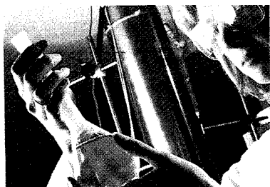
위험성과 한계를 잘 이용해야 한다.

들어가지 않고 손에 닿는 물건을 알콜로 소독하지 않고서는 못사는 사람도 있다. 그런 사람이 전염병에 대하여 특별히 안전한지 크게 의심스럽다. 그러나 불결한 생활을 하거나 비위생적인 식품을 먹는 것이 위험함은 누구나 잘 알고 있다. 인간은 미생물에 대한 공포와 함께 그 위험의 한계를 알게 됨으로써 박테리아와 훌륭하게 함께 사는 법을 배운 것이다.