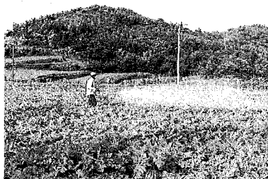
잔류량에 영향을 미치는 것은 수확기 가까이 뿌리는 1~2회에 불과하다.

그러면 「사용기준」은 잘 지켜지고 있느냐 하는 질문을 많이 받는다. 답하기 어렵지만 필자는 대부분 지켜지고 있다고 생각한다. 옛날 BHC처럼 효력범위가 넓고 잔류성이 큰 농약을 썼던 시대에는 「사용기준」을 지키는 것이 어려웠을지 모른다. 그러나 오늘날의 농약은 잔류성이 작은 것이 많다. 또 농약의 종류가 늘어난 만큼 적용범위는 좁아지고 농약을 쓰는 법은 어려워졌다. 제품의 표시를 잘