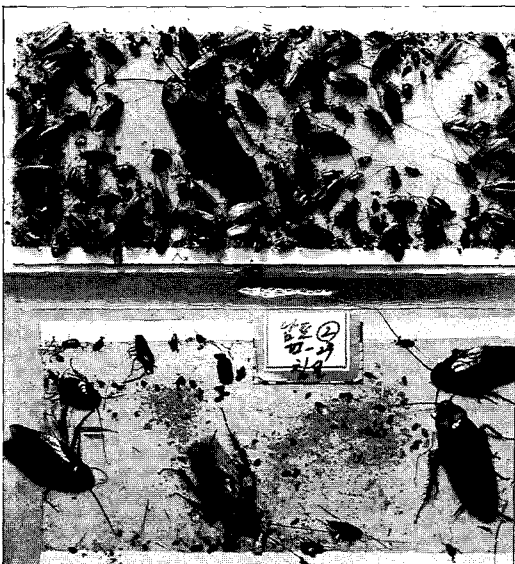
끈끈이 트랩에 채집된 바퀴류. 윗쪽 사진에 많이 잡힌 작은 개체들이 바퀴이다. 윗쪽 사진 왼쪽 중간의 큰 개체와 아랫쪽 사진 중앙의 두 개체는 이질바퀴이며 아랫쪽 사진 양끝에 있는 두 개체는 먹바퀴이다.

한 건물이 떨어져 있으므로 건물간의 바퀴류 이동이 중요시 되며, 그 발생양태가 복잡하여 전체적인 방제가 어렵다. 주택지의 독립된 개인주택은 각 주거인의 방제의식이 중요한 역할을 한다. 이런 장소외에 특수 서식지로는 병원, 대형창고, 공장, 항공기, 선박, 생산공장 등을 들수 있겠는데 각 서식처 마다 생태적 여건이 다르므로 바퀴류 피해는 상당히 다른 경제성을 가진다. 이런 특수 서식지에서는 방제에 대단히 신중해야 하고 고도의 방제기술을 요한다.