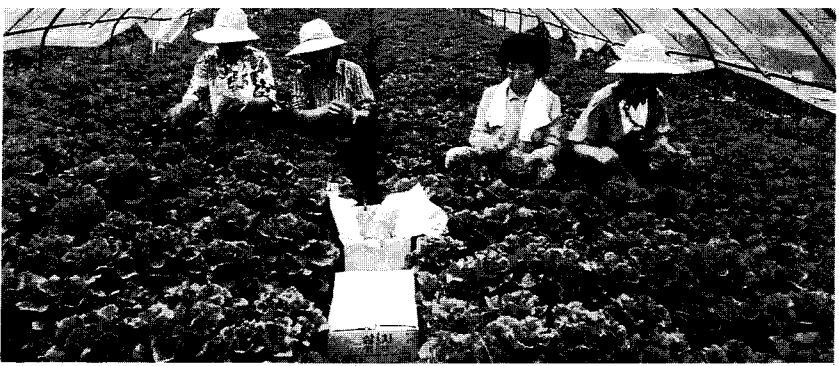
사용자가 정해진 방법으로 사용하면 잔류농약의 안전성은 확보된다.

농작물군에서 잔류량이 많고 \Sigma 치를 ADI \times 50 이하로 낮출 수 없는 경우 그 농작물군은 그 농약의 사용대상에서 제외한다. 또 농작물에서의 잔류량이 낮은 경우에는 충분히 농약을 썼을 때의 잔류량에 약간의 여유를 둔 값을 기준치로 하고 있다. 이 경우에는 \Sigma 치와 ADI \times 50 치 사이에 상당한 차가 생긴다. 따라서 잔류기준이 낮다고 해서 만성독성이 강하다고는 할 수 없다. 그 밖의 경우에도 실제로 \Sigma 치는 ADI \times 50 의 70~80%인 것이 많다. 이것은 농작물 이외의 경로로부터의 농약섭취를 고려한 때문이다.