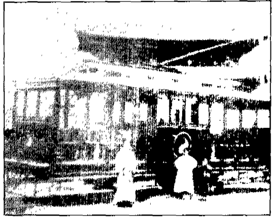
▲ 한성전기시대의 전차