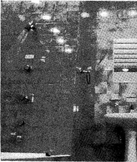
<지역난방을 시설하면 값싼 비용으로 열원(熱源)을 얻어 난방은 물론 우리 생활에 필요한 모든 온수를 공급받을 수 있다.>