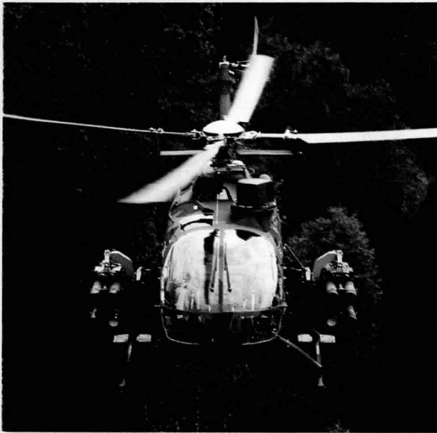
BO-105는 軍 및 민간용으로 약 1천4백여대가 세계적으로 운용되고 있다 사진은 BO-105CB 헬기