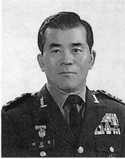
李相浩 국방부 군수본부장

세계 방산시장에서는 고도의 과학기술전에 맞는 첨단 정밀과학기술 무기의 수요가 늘고, 방어전력 유지에 필요한 자원 절약형 기술 중심의 무기가 요구될 것입니다. 아울러 군비통제의 확산으로 기존 방산시장의 축소는 물론 방산시장의 확보를 위한 각국의 경쟁은 더한층 치열해질 것으로 예측됩니다