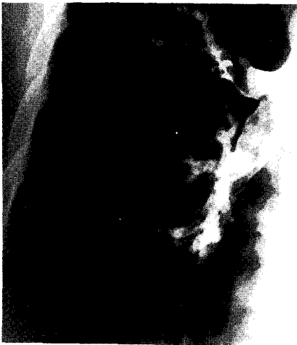
Fig. 3. Bronchography shows tubular bronchiectatic changes on right lower lung fields (176th HD).

이 자주 동반되어 입원 68일째 기관지 내시경 검사를 시행하여 기도내 수포를 발견하였고(Fig. 2), 반복되는 폐렴과 계속되는 각혈의 원인을 규명하기 위하여 입원 176일째 기관지 조영술을 실시하여 기관지 확장증을 확인하였다(Fig. 3). 또, 입원 60일째 부터는 환자의 호흡곤란도 약간씩 호전이 있어 폐기능검사를 실시하여 폐기능호전을 객관적으로 관찰할 수 있었다(Table 2).