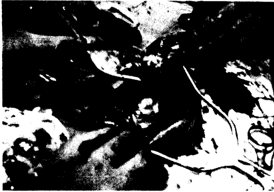
Fig. 3. Procedure of aneurysmectomy.