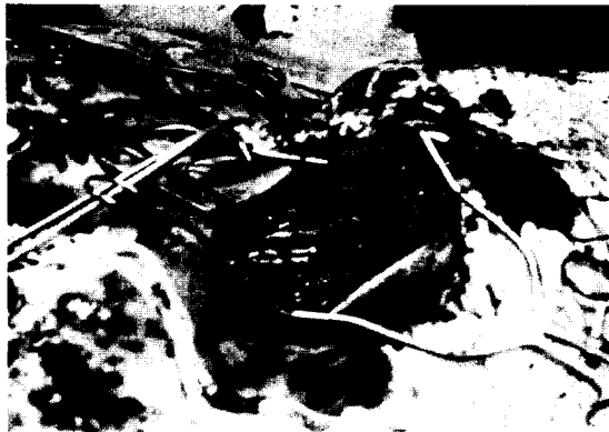
Fig. 4. Reconstructed internal carotid artery with a saphenous vein.