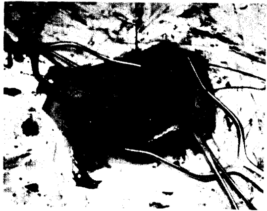
Fig. 2. Gross findings of exposed aneurysm.

병 등은 없었고 뇌혈관질환 및 경부 외상도 없었다. 환자는 평소에 건강하게 지냈으나, 약 6개월 전부터 왼쪽 경부에 종물이 돌출되면서 간헐적으로 경부 및 안면에 통증이 있었고 이 통증은 좌측 이의 후방으로 전이 되었다. 이학적 소견상 전신상태는 양호하였고 두경부소견에서 안검하수는 없었고 좌측 측동이 경미하게 있었으나 동공반사는 정상이었다. 좌측 경 상부에 3×4cm 크기의 연성 종류가 돌출 되었고 청진상 잡음이 들렸다. 기타 검사 소견은 모두 정상 이었다. 경동맥 동맥류가 의심되어 경동맥혈관조영술(Fig. 1) 을 시행하였다. 좌측 경동맥 분지부 약 1.5cm 상방의 내경동맥에 3×4cm 크기의 Saccular형의 동맥류가 확인되었고, 동맥류의 원위부는 하악각의 바로 직하방 까지 확장되었다. 우측 경동맥 및 양측 대뇌 반구의 동맥계는 정상소견을 보였다. 좌측 내경 동맥류 진단 하에 동맥류절제술 및 혈류재건술을 시행할 계획으로 수술을 시행하였다. 양와위에서 환자의 왼쪽 경부를 우측으로 편위시키고 Sternocleido mastoid 근육의 앞쪽 경계부에 절개를 가하여 경동맥 분지와 동맥류를 노출시켰다(Fig. 2). 경동맥 분지를 박리한후 1% lidocaine 2cc를 내경 동맥과 외경 동맥 사이의 조직에 주입하여 경동맥체 및 경동맥동으로 가는 신경을 일시적으로 마비시켰다. 동맥류는 경동맥 분지 약 1.5cm