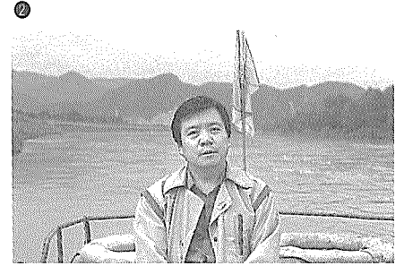
③ 옛고향 풍경 그대로다.

어랑촌 항일유적지를 둘러서 용정마을을 지나 해란강을 끼고 달려 延吉에 도착했을 때는 이미 오후 3시가 좀 지나서였다. 백산호텔에 짐을 푼 후 곧장 圖門으로 직행이다.