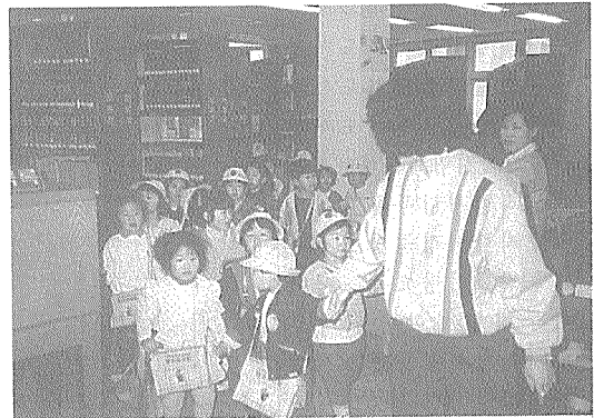
상주시공공도서관 : 도서관 견학