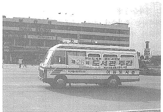
부산직할시립시민도서관 : 가두캠페인

또한 동행사를 주관하는 당협회는 현재 우리 도서관계가 처해있는 문제점 및 해결방안 그리고 행사내용을 언론사에 보도의뢰한 바 의외로 좋은 반응을