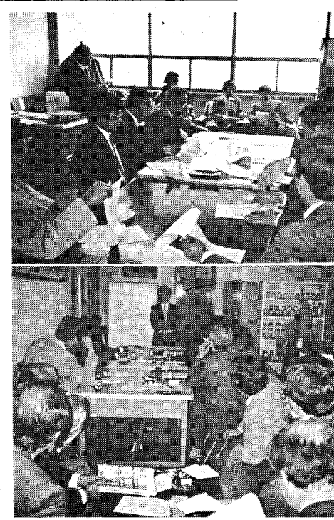
◇제1차 이사회 광경

그대로라면 우리는 유안으로 본능(動)의 진단으로 게 활용해야겠다. 사실 병원의 진단에 의 해 병명이 붙여져서 비로 소 질병이 되는것이 아니 라 아침에 일어나면서부터 움직이고, 일하고, 자는 때 시작마다 몸의 이상이 있 음을 의식할 때 이미 병은 시작되었거나 시작될 조짐 이 되어있는 것이다. 그대로라면 이와같이 자 각 된 불면증상을 그대로 대 버려두거나 또는 자기의진 단없이 미리그 원인을 살피고 예방해 버린다가 이 들중에 어느것을 택하느냐 에 따라 이 엄청난 현대 사회를 주어진 복대로 사 는 지혜가 생긴 것이다. 옛 선인들의 장수비결 보 험보통(補補補)등에 현 정보통(補補補)등에 현 후회되기 전에 각자의 몸을 현실에 맞게 적용시켜 나 가는데 참다운 진단의의 있다고 하겠다. 진단 우리는 매일 아침 세수 를 하고 한밤중은 거울에