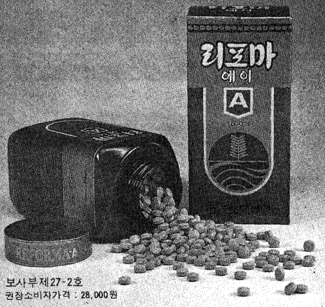
보사부제 27-2호 권장소비자가격 : 28,000원