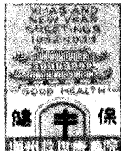
한국 최초의 썰 1932년