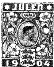
세계 최초의 썰 1904년