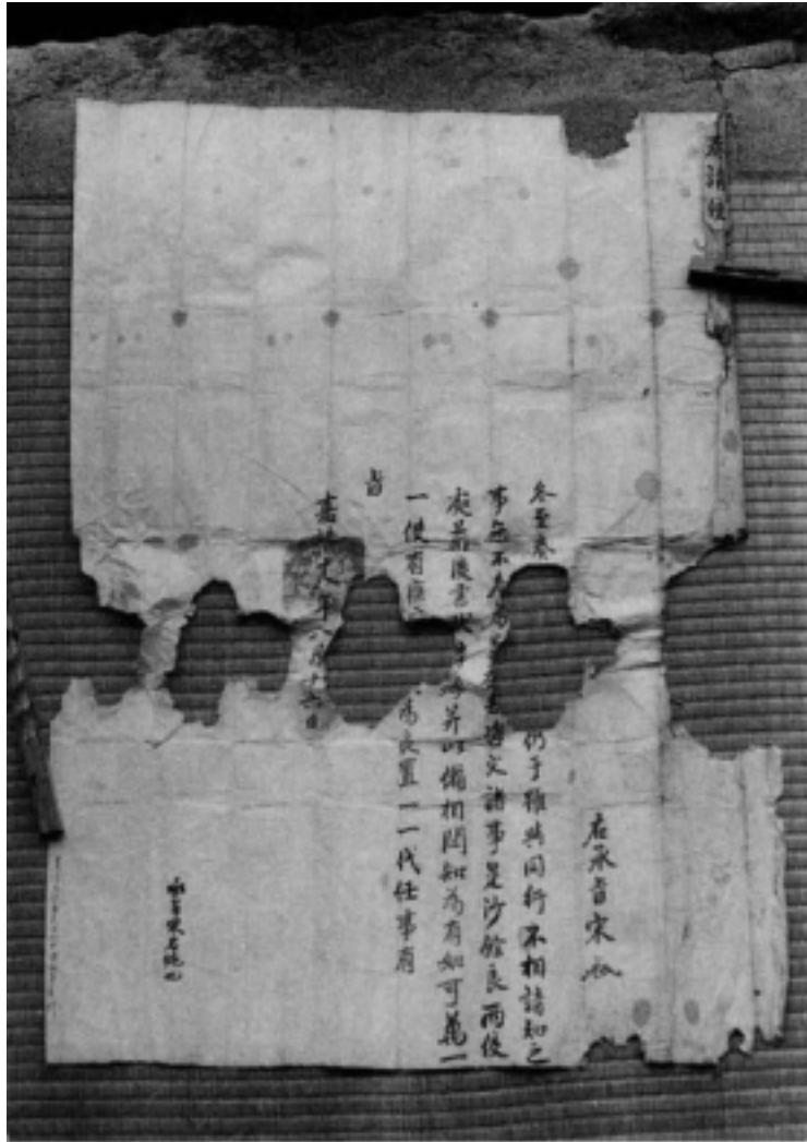
사진 3 有 旨