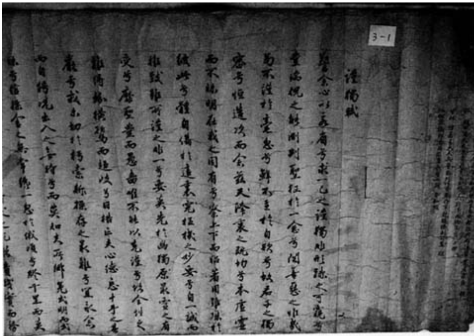
사진 4 권동輔 試券