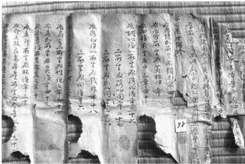
사진 9 분재기