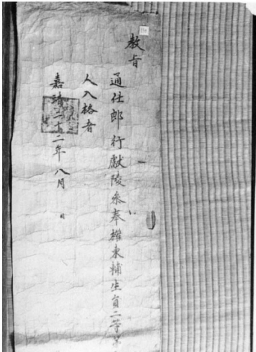
사진7 권동보(權東輔) 백패교지(白牌教旨)