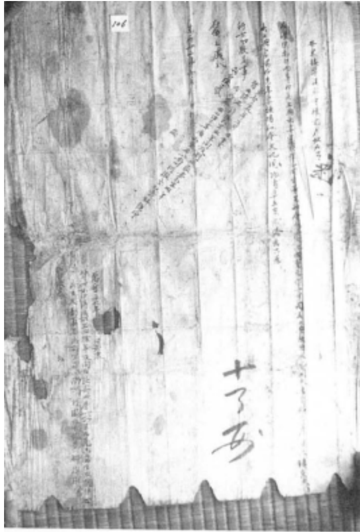
사진 12 所 志