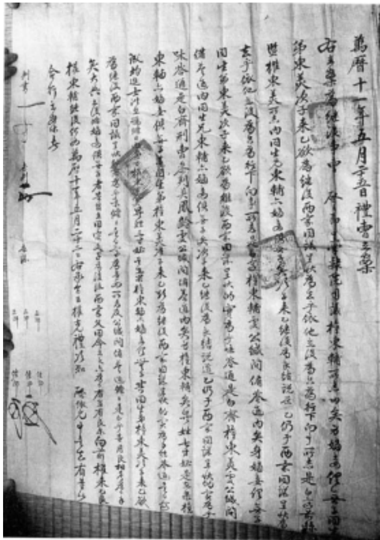
사진 8 禮曹立案