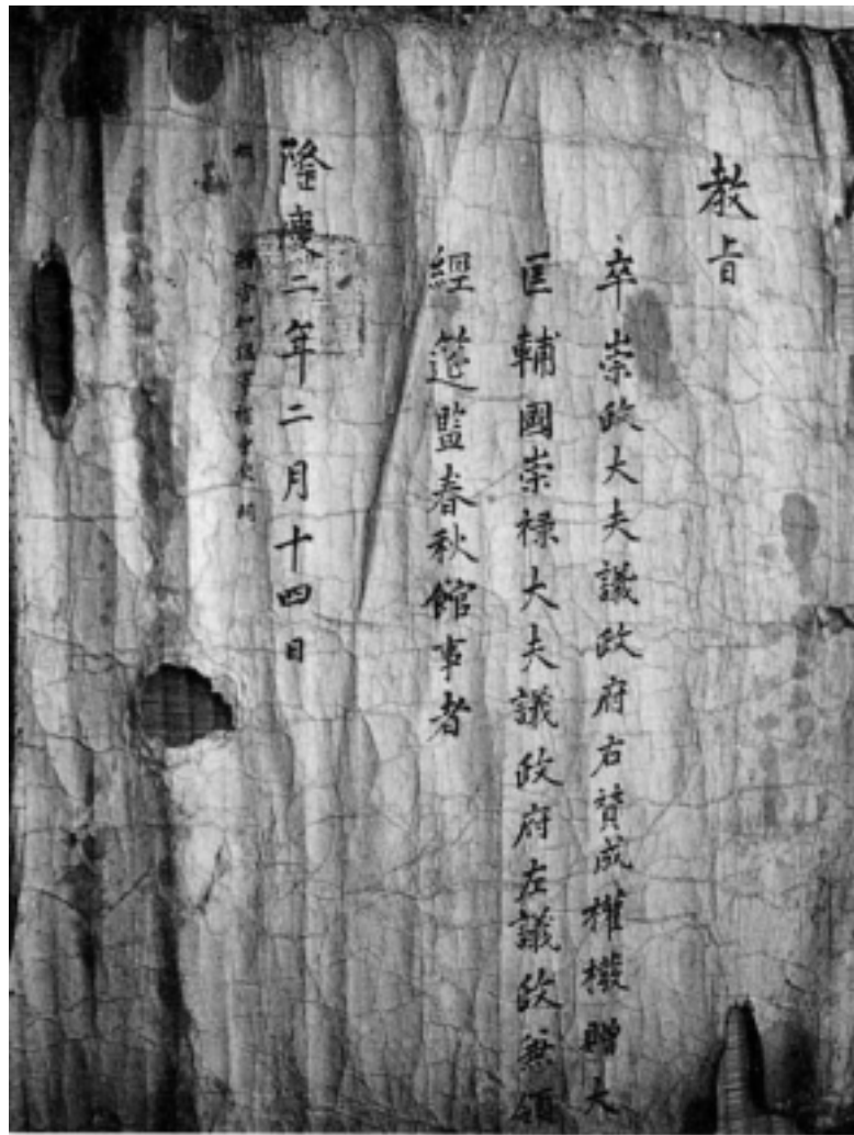
사진 6 權楨追贈 教旨