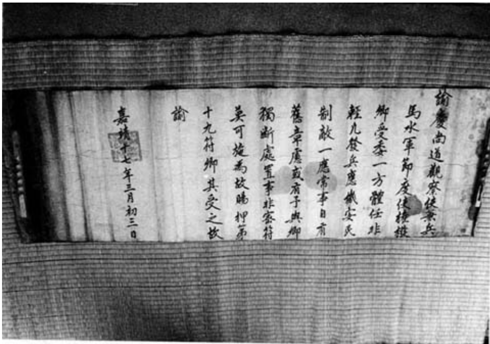
사진 2 諭 書