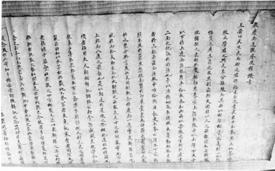
사진 1 教 書