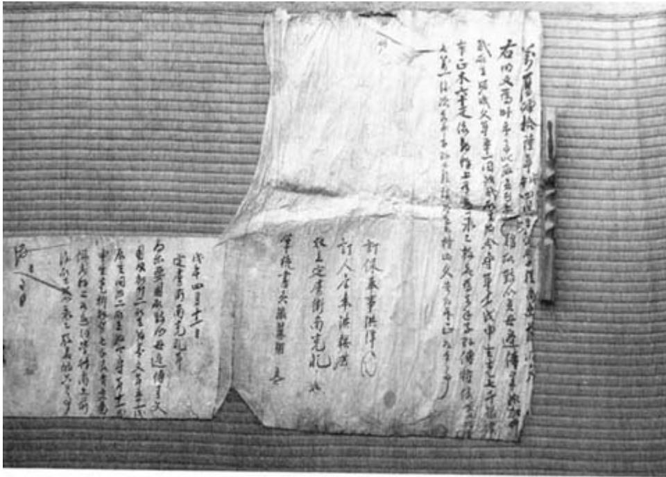
사진 11 明 文