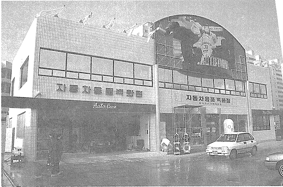
◀ 자동차용품 전문 백화점 - 여의도 오토타운.