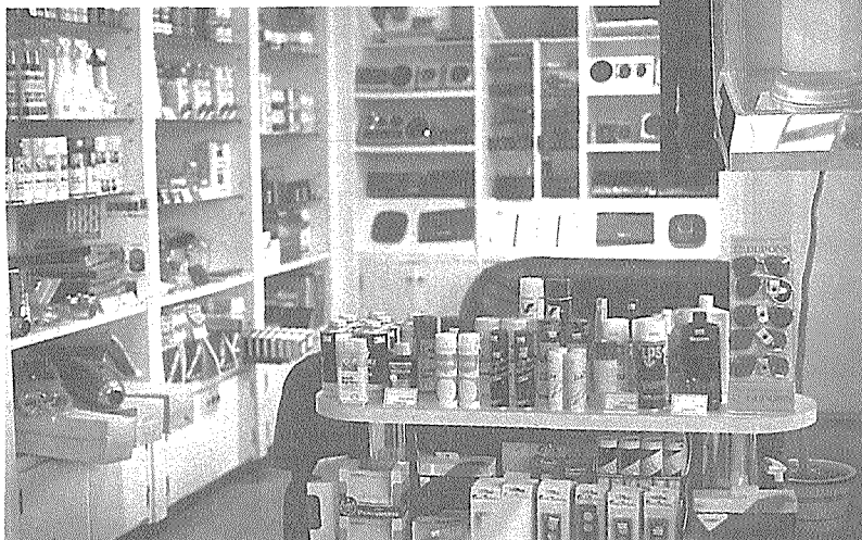
◀ 잠실주유소내에 설치된 TBA매장