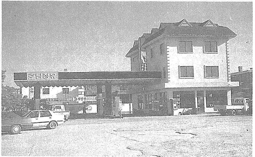
주유소건물의 획일화 ▶ 에서 벗어나 소비자에 게 색다른 의미를 부여 해 주고 있다.