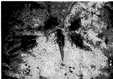
〈목화진딧물 무시충과 유시충〉