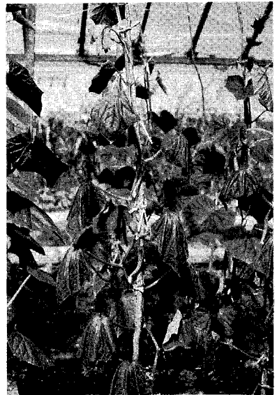
〈뿌리혹선충에 의한 오이의 지상부마름 증상〉

으로 침입한 뒤 뿌리조직 속에서 세번 허물을 벗고 어른벌레가 된다. 뿌리속에서 영양분을 흡수하면 그 주위세포가 이상비대하고 이것들이 모여 뿌리혹을 이루며, 이곳이 선충의 양분보급창고가 된다. 암컷은 커가면서 서양배모양이 되고, 다자라면 몸뚱부분을 뿌리겉쪽으로 향하고 젤라틴같은 물질을 뿌리겉으로 분비하여 알주머니를 만든다. 그 속에 500~1,000개의