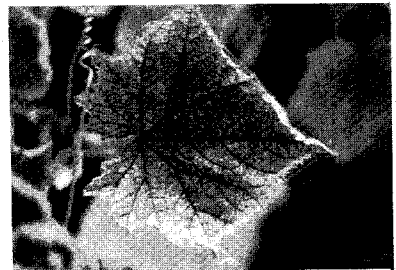
〈점박이응애에 의한 오이의 피해〉

피해가 진전되면 잎이 하얗게 변색되고 결국 고사한다. 주로 하위엽쪽을 가해한 후 새잎이 나오에 따라 위로 옮겨가며 번