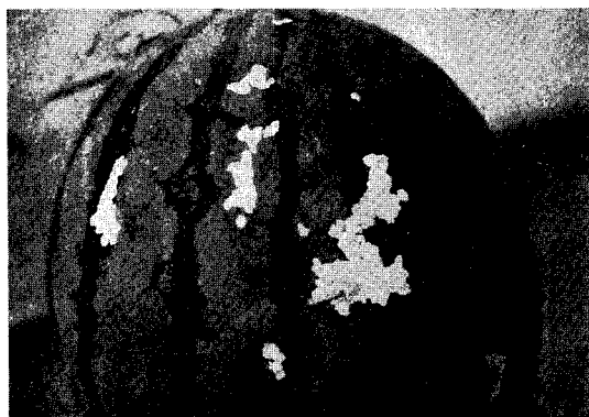
파밤나방에 의한 수박의 피해