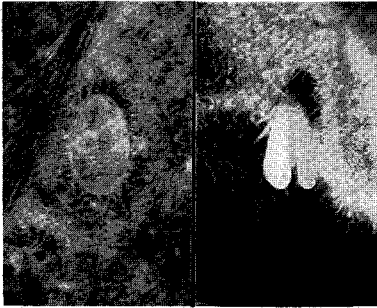
〈온실가루이 번데기(왼쪽)와 성충〉

위쪽앞으로 이동하여 산란한다. 성충의 수명은 16~28일이고 알은 하루에 8개정도 낳는데 암컷 1마리가 200개천후를 낳는다. 알기간은 4~8일, 1령기간은 3일, 2령기간은 2일, 3령기간은 2~3일이며 번데기 기간은 7~10일이다. 알에서 성충까지 3~4주가 소요되는데 증식력이 높아