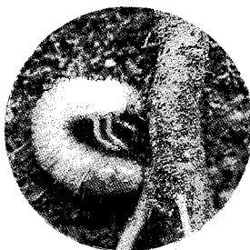
부리를 가해하는 풍뎅이 유충(굼벵이)