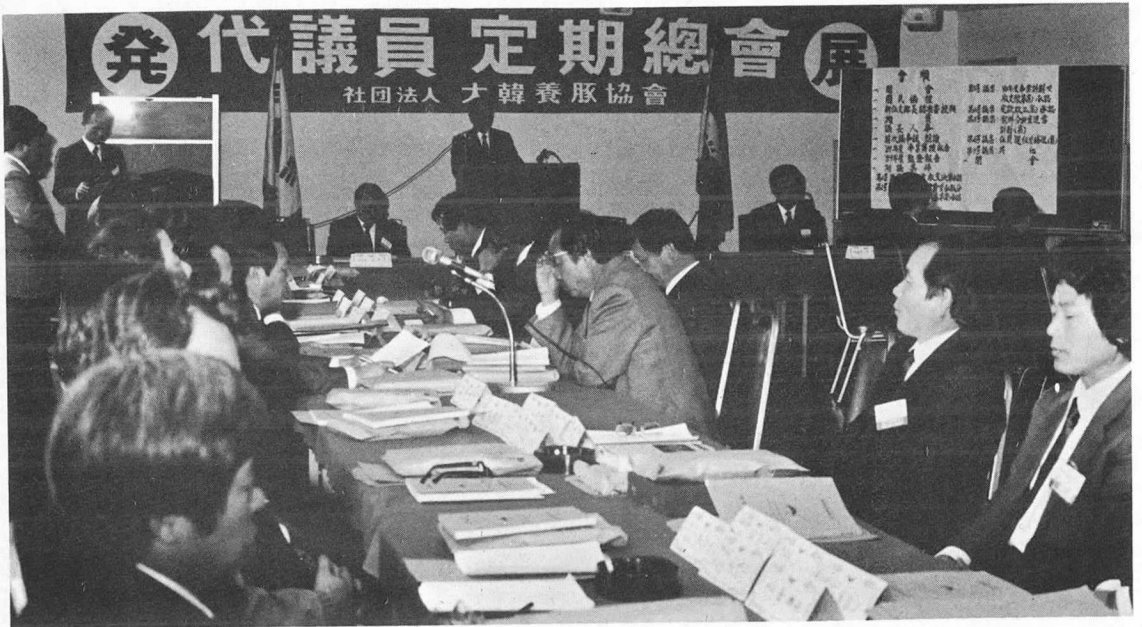
▲ 본회 제11차 대의원 정기총회 장면

본회는 지난 2월 26일 양돈회관 5층 대회의실에서 대의원 60여명이 참석한 가운데 제11차 대의원 정기총회를 개최했다.