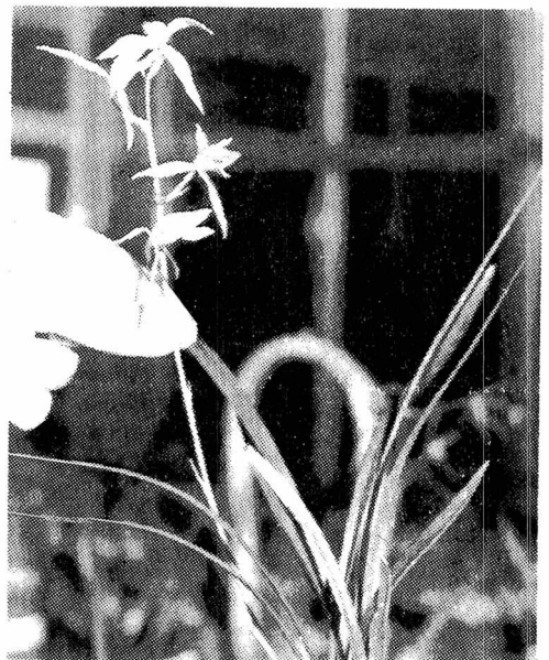
△ 사진 : 濟州寒蘭 인공開花 성공 제주도 농촌진흥원이 인공배양한 제주寒蘭을 꽃피우는데 성공, 관련학계의 비상한 관심을 모으고있다. (11. 16. 濟州=聯合·韓國經濟)