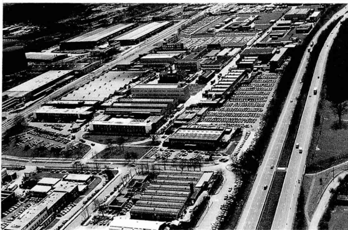
프랑스의 Aerospatiale사와 서독의 MBB사가 합작하여 설립한 Euromissile사의 면허를 획득한 영국 공장 전경