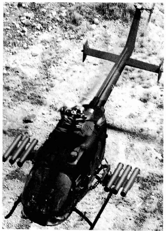
헬기는 HOT 유도탄의 이상적인 탑재장비이다 사진은 HOT 유도탄을 탑재한 독일 육군의 BO-105 헬기