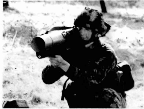
▲ 헌팅 엔지니어링社의 LAW-80