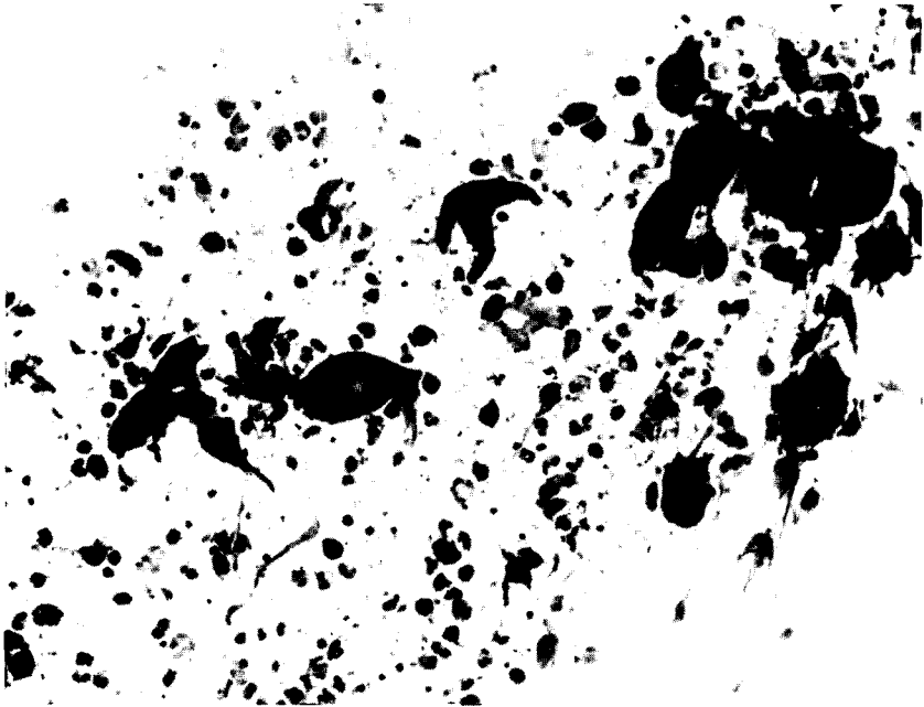
Fig. 4. Positive reaction for HSV-1 antigens throughout the cytoplasm and nuclei of the multinucleated and mononucleated giant cells from Tzanck smear (PAP for HSV-1, \times 200 ).