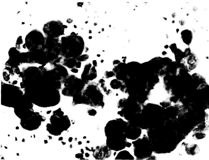
Fig. 2. Several clusters of diagnostic multinucleated giant cells with ground glass nuclei and nuclear molding from Tzanck smear of skin vesicle (Wright-Giemsa, \times 400 ).