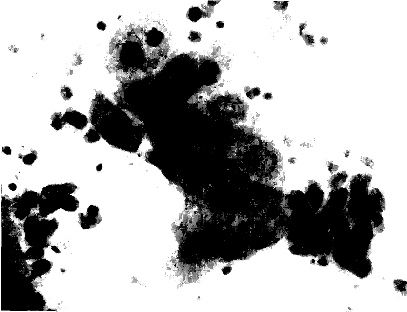
Fig. 1. Hypertrophic squamous parabasal cells with amorphous chromatin pattern showing early changes of herpetic infection (Papanicolaou, \times 400 ).