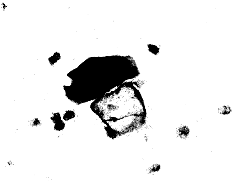
Fig. 5. One intermediate cell in alcohol-fixed cervical smear showing strong immunoreactivity for HSV-2. Though strong staining is visible in the cytoplasm, there is also some immunoreactivity in the nucleus (PAP for HSV-2, \times 400 ).