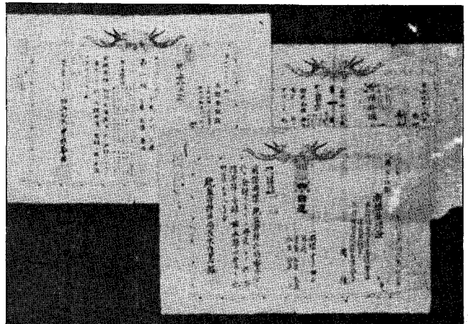
〈우리나라〉 商標登錄證 第1号

위 不登錄事由中에서 가장 問題가 되는 他人의 先登錄 商標의 存在如否를 알아보기 위해서는 特許廳關覽室에 備置된 商標公報를 關覽하면 쉽게 알 수가 있다.