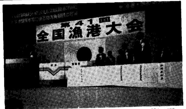
▲일본 靜岡市에서 열린 제41회 전국어항대회(위사진). 어항관계자 3천3백명이 대회장을 북 메웠다(가운데사진).

수산청은 어항법개정법률시안을 확정할 방침이다. 다시 손질 보완하고, 곧 최종안을 확정할 방침이다. 수산청은 어항법개정법률시안을 확정할 방침이다. 다시 손질 보완하고, 곧 최종안을 확정할 방침이다.