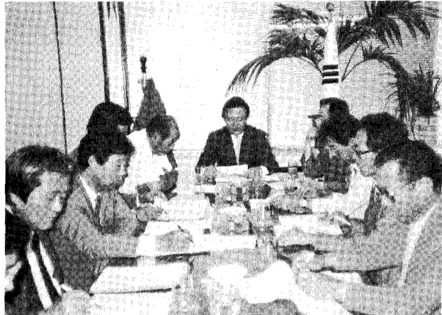
韓國漁港協會 회의실에서 열린 漁港施工業體懇談會서 漁港工事의 特殊性이 특히 強調됐다.

한국어항협회는 재무부가 입법예고한 예산회계법시행령개정안과 관련, 지난 8월 18일 하오 긴급 회원간담회를 개최하고, 어항공사의 특수성을 감안한 수의계약인정과 현행 계약사무처리 규칙 제39조제1호의 「나」항의 존치 등을 위해 업계가 전력을 투구, 이를 관철시키기로 했다.