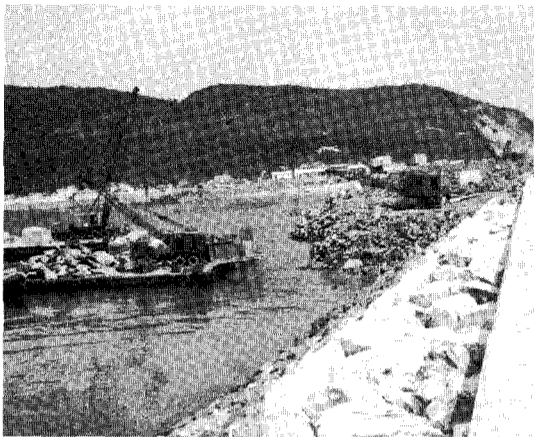
올해어항 건설은 35개항중 5월22일현재 22개항이 착공되는 등으로 97%의 계약 진척률을 보이고 있다.