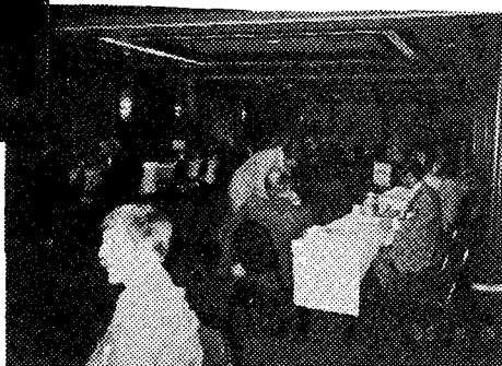
▶ Marriott Hotel에서 가진 개별면담 장면

미국무성 산하 교역개발계획(TDP) 지원으로 노스웨스턴대학의 IBD와 본 협회가 주관하여 4월 9일부터 10일간 추진한 무역회담(Trade Mission)에서는 한국의 방지시설업체 및 관련 기계제조업체로 구성된 21명의 단원으로 이루어졌으며, 미국측도 같은 종목으로 쌍방간의 무역이익을 추구하고자 하였다.