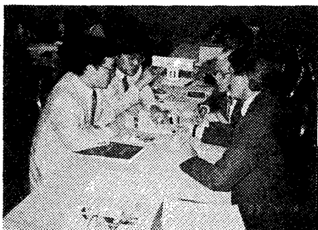
▲ Red Lion Inn에서