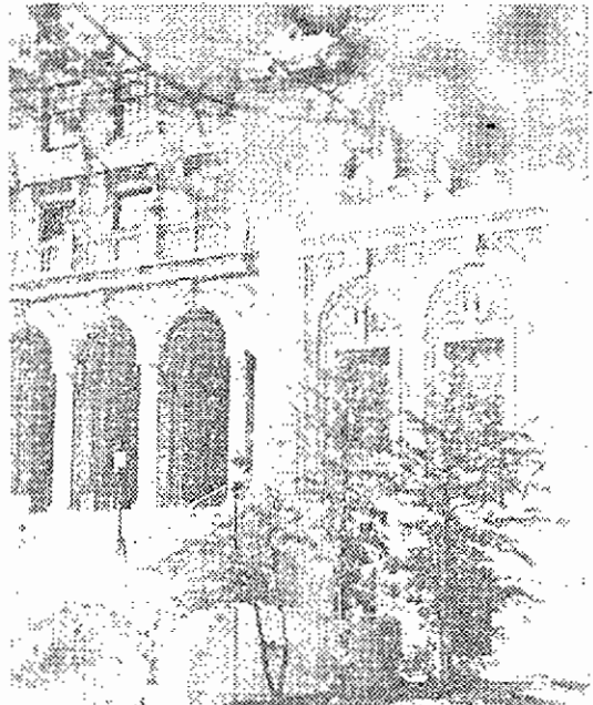
▲ 위스컨신州의 호수, 많은 눈(雪)과 아름다운 경치는 영화의 좋은 배경이 되기도 한다(사진은 캠퍼스의 봄 풍경).

물이 모이는 땅이라는 인디언 말에서 따온 위스컨신州名에 걸맞게 위스컨신州에는 많은 호수와 강이 있으며 이와 함께 중서부에서는 유일하게 구릉 지대가 있어 산과 계곡을 감상할 수 있다. 그로 인해 겨울에는 스키를 탈 수 있는 지역으로 중서부에서 이름난 휴양지가 많은 州이기도 하다. U.W.-Madison이 자리잡은 Madison市는 인구 17만 명의 州정부와 학교가 근간을 이루는 조용하고 쾌적한 도시로 미국내에서 아름답고 살기 좋은 10대 도시에 끼이는 곳이다. 이곳에도 Mendota와 Monona 등의 4개의