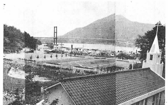
〈10월28일 준공된 남해대교 주차장〉

따라서 이번 주차장의 준공으로 관광객의 체류로도모하고 문화유적및 기존취락을 정비하여 국립공원으로서의 면모를 일신하고 지역사회발전에 도 크게 기여하게 될 것으로 기대된다.