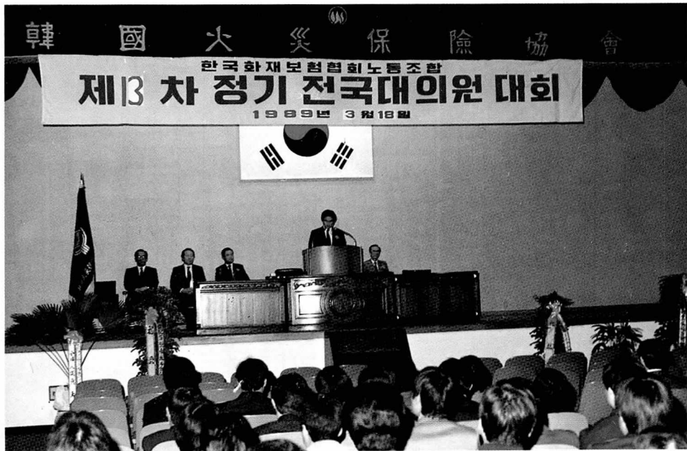
노조 정기대의원 대회 본 협회 노동조합은 지난 3월18일 제13차 노조 정기대의원대회를 개최.