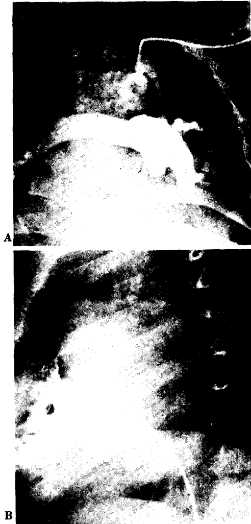
Fig. 3. Post-operative state. A. left modified Blalock-Taussig shunt was performed. B. lateral view, RV angiogram. postoperatively, no growth of right ventricle was shown so that this patient underwent modified Fontan operation.

터 변형 Fontan술식을 시행하였고 다른 1례에서는 단락술후 변형 Fontan술식을 시행하였으나 술후 13일째 중격동염 및 패혈증으로 사망하였다.