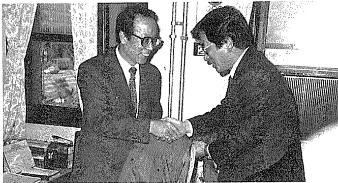
서울지부장이 김인식 서울시 건설관리국장에게 불우이웃돕기 방한복을 전달하였다.

1월 12일 서울에서 추진한 17개구청 관할지에 거주하는 불우이웃에게 방한복 3백40벌(3백70만원 상당)을 관할구청을 통하여 전달 하였다.