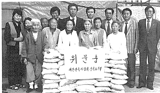
경기도 지부장과 간사등 일행은 구랍 26일부터 29일까지 도내 불우이웃을 돕기 위해 바쁜 연말을 보냈다.