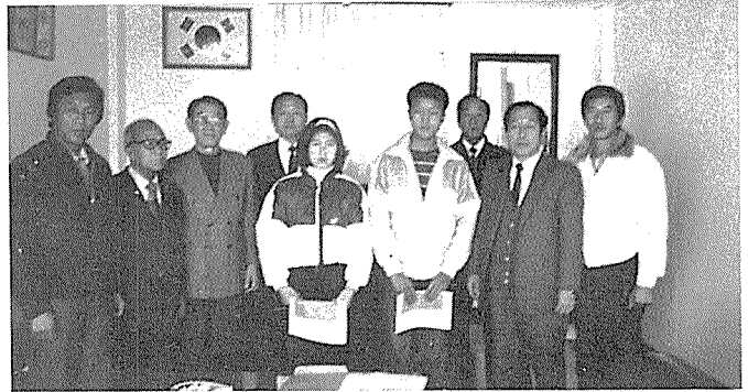
소년소녀 家長과 자매결연을 맺고 물심양면으로 돕고 있는 전남지부 회원들