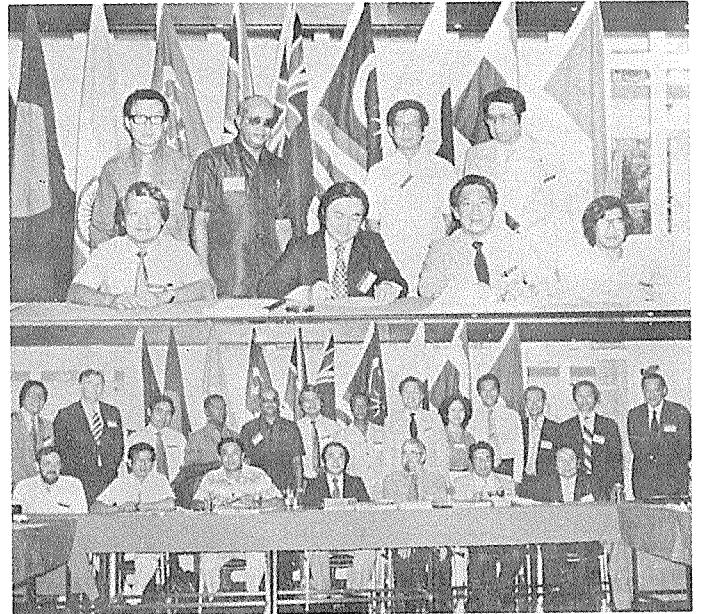
제 2 회 아카시아 건축사협의회가 제 2 회 아카시아 강습회와 병행하여 1981년 8월 홍콩에서 개최되었다.

대표자)로 하여금 새 이사회를 개최하게 되었다. 1980년에 10개 협회가 정관을 찬성하였고 그해 8월에 첫번 아시아건축사협의회 이사회회의와 아시아건축교육위원회가 방콕에서 개최되었다. 이에의해 정기적인 연례회의를 여러 협회회원국에서 개최하기로 하였다. 1981년 3월에 제1회 아시아건축사협의회 강습회가 마닐라에서 개최되었다. 이 회의기간동안, 용역활동 국제윤리법에 대한 아카시아 규약(안)이 필리핀 건축사협회에 의해 제의되었고, 1983년에 이 규약이 모든 10개 협회회원국에 의해 승인되었다. 이 규약은 1981년에 바르샤바에서 개최된 UIA 총회와 1981년 나이로비에서 개최된 CAA 회의에서 제출되었고 또한 아시아연맹공학단체와 국제연맹용역단체에 각각 제출되었다. 아시아 주택 및 설계 연합회에서는 이 규약을 이미 승인한바 있다. 제2회 아카시아 이사회 회의가 1981년 8월에 홍콩에서 개최되었다. 중공과 대만 건축사협회가 초청참관국으로 참석하였다. 이 회의에서 타겟출판 및 투자회사가 건축학 학생들을 위하여 여행장학금을 마련하였다. 이 장학금은 필리핀에서 유력한 건축사의 기증금에 의해 그 원조가 더 강화되었다. 장학금은 졸업한 학생들로 하여금 다른 아시아 국가에서 여행하고 일할 수 있도록 마련된 것이다.