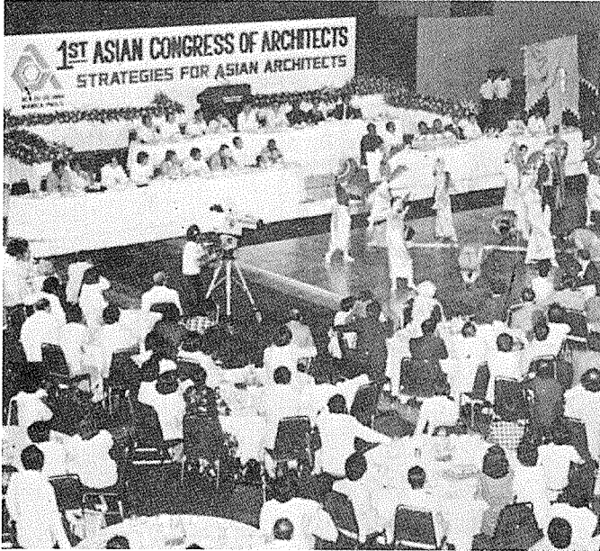
ACA-1 개회식 (필리핀 International Convention Center에서)