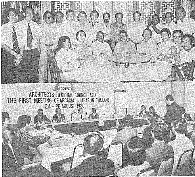
제 1 회 아시아 건축사협의회와 아시아 건축교육위원회가 태국의 수도 방콕에서 1980년 8월 24일부터 2일간 개최되었다.

대표자)로 하여금 새 이사회를 개최하게 되었다. 1980년에 10개 협회가 정관을 찬성하였고 그해 8월에 첫번 아시아건축사협의회 이사회회의와 아시아건축교육위원회가 방콕에서 개최되었다. 이에의해 정기적인 연례회의를 여러 협회회원국에서 개최하기로 하였다. 1981년 3월에 제1회 아시아건축사협의회 강습회가 마닐라에서 개최되었다. 이 회의기간동안, 용역활동 국제윤리법에 대한 아카시아 규약(안)이 필리핀 건축사협회에 의해 제의되었고, 1983년에 이 규약이 모든 10개 협회회원국에 의해 승인되었다. 이 규약은 1981년에 바르샤바에서 개최된 UIA 총회와 1981년 나이로비에서 개최된 CAA 회의에서 제출되었고 또한 아시아연맹공학단체와 국제연맹용역단체에 각각 제출되었다. 아시아 주택 및 설계 연합회에서는 이 규약을 이미 승인한바 있다. 제2회 아카시아 이사회 회의가 1981년 8월에 홍콩에서 개최되었다. 중공과 대만 건축사협회가 초청참관국으로 참석하였다. 이 회의에서 타겟출판 및 투자회사가 건축학 학생들을 위하여 여행장학금을 마련하였다. 이 장학금은 필리핀에서 유력한 건축사의 기증금에 의해 그 원조가 더 강화되었다. 장학금은 졸업한 학생들로 하여금 다른 아시아 국가에서 여행하고 일할 수 있도록 마련된 것이다.