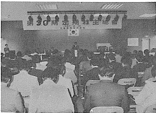
제30기 정기 주주총회