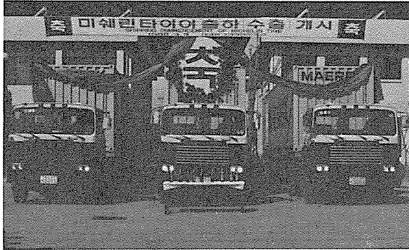
미쉐린 타이어 수출 개시

프랑스 미쉐린사가 각 50%의 자본으로 합작 설립한 양산 공장에서 승용차용 래디알 타이어를 지난 3월 15일 처녀 수출을 시도하였다.