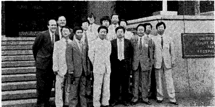
〈美國特許高等裁判所에서 研修生一同〉

이번 研修에 있어 美國特許廳長을 만나 特許廳의 業務現況을 들을 때 ① 審査官을 中心으로 水準높은 知的所有權研修를 하여 資質을 向上하고 ② 最近 5年동안 審査官 1,500名을 늘려 審査續滯現狀을 해소하여 審査處理期間을 平均 1年 6個月로 短縮시켰으며 ③ 關係機關