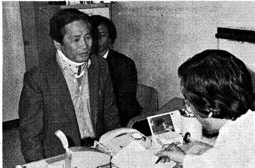
◆동맥경화증은 일단 발병하여 증상이 나타나면 치료가 극히 부진하고 만족스럽지 못한 경우가 적지않다. 따라서 모든 병이 그러하듯 예방이 최선의 치료이다(사진은 記事 특정사실과 관련 없음).